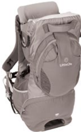
Freedom Child Carrier (L10520) Complies to EN 13209-1:2004